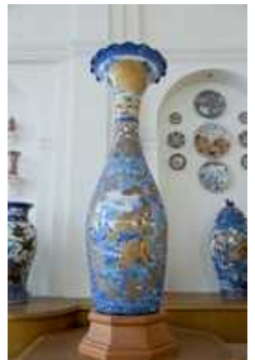
香蘭社《色絵獅子牡丹文大皿》

世界を魅了した華麗なる作品の数々を通じて、近年脚光を浴びる明治時代の美術、明治有田の魅力をご堪能ください。