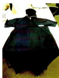
⑨ロッカールームで制服に着替えます。

採用する者が決まると本人と各セクションの中心となる職員との顔合わせを行ない、その後、清掃箇所を見て回りどのようなことをするか、また各セクションの職員との顔つなぎを進めていきました。この清掃箇所の見学に先立ってシェラトンホテル広島では「入社から退勤まで」というパンフレットを作成しました。